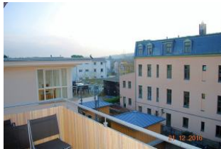
Blick vom Balkon.