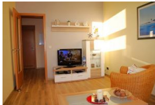
2.Blick in das Wohnzimmer.