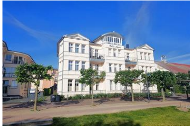
Blick von der Promenade auf die Villa.