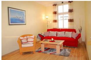
Blick in das Wohnzimmer.

Die Villa Anna ist in erster Reihe direkt an der Strandpromenade gelegen. Das Gebäude wurde aufwändig saniert und ausgestattet. Das Appartement verfügt über einen Wohnraum mit einer Doppelschlafcouch (bequem mit 180 cm x 200 cm), einen Schlafraum mit Doppelbett und eine separate Küche. Das Bad ist mit Badewanne und Duschkabine ausgestattet. Vom großzügigen, südlich ausgerichteten Balkon aus hat man einen Blick über die Ahlbecker Dächer.