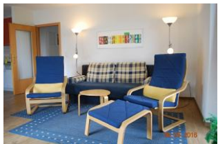
Blick auf die Sitzlandschaft.