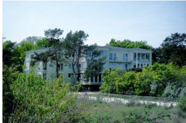
Blick von der Düne auf das Haus.