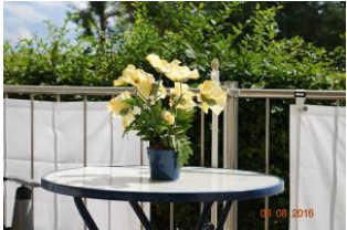
Blick auf den Balkon.