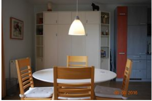
Blick auf den Essplatz und das Schrankbett.