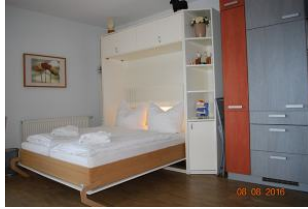
Blick auf das Schrankbett im Wohnraum.