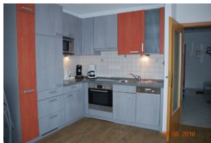
Blick auf die Küche.