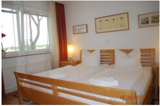
Blick in den Schlafrum.