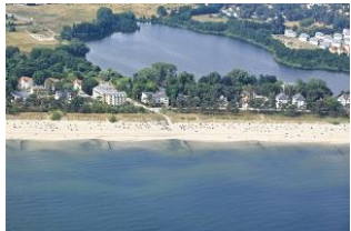
Blick aus der Luft.

Direkt an der Ortsgrenze Heringsdorf / Bansin gelegen, entstanden im Jahr 2002 zwei Strandvillen auf einem ca. 3.300 qm großen Grundstück mit altem Baumbestand und direkter Ostseelage. Das Appartement liegt im Erdgeschoss mit großzügigem Wohnraum - und dem dort integrierten Doppelschrankbett - und angrenzendem Balkon. Hier wohnen Sie in der ersten Reihe und können den breiten und feinkörnigen Strand in wenigen Augenblicken erreichen.