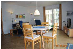
Blick von der Küchenzeile in den Wohnraum.