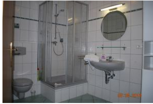
Blick in das Bad.